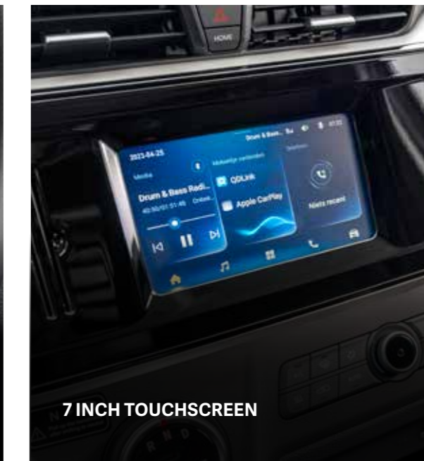
7 INCH TOUCHSCREEN