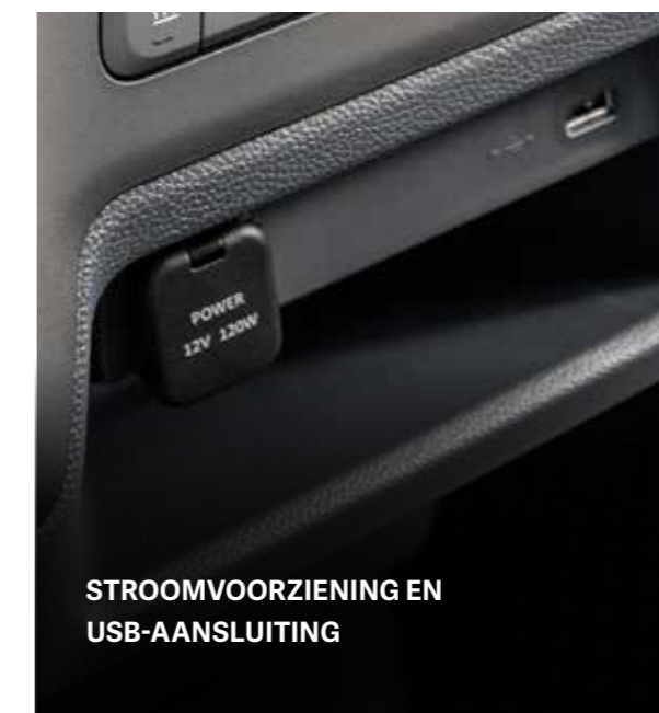
STROOMVOORZIENING EN USB-AANSLUITING