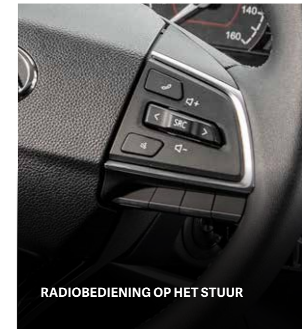
RADIOBEDIENING OP HET STUUR